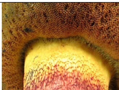
BOLETUS LURIDUS F. PRIMULICOLOR_4