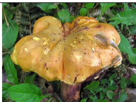
BOLETUS LURIDUS F. PRIMULICOLOR_1

RILIEVI EFFETTUATI SU REPERTI FRESCHI SECCHI