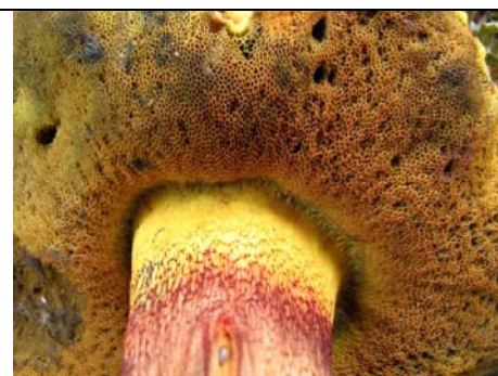
BOLETUS LURIDUS F. PRIMULICOLOR_3